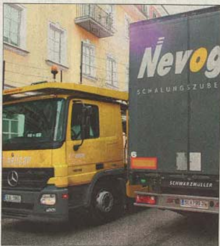
Dauerbrenner: der Stadtplatz von Mattighofen

Die Stadt Braunau tritt als jüngstes Vereinsmitglied ebenso gegen eine Transitlawine an. „Laut einer Studie von Knofla-